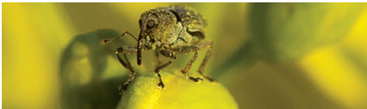
Abb. 1: Großer Rapsstängelrüssler ( Ceutorhynchus napi. )

Der 3,2-4 mm lange, und im Grundton grauer, Rüsselkäfer mit schuppiger Behaarung und einem langen, dünnen, gebogenen Rüssel beendet bei einer Bodentemperatur von 5-7° C. seine Winterruhe. Dies entspricht einer Lufttemperatur von ca. 9-12° C. Nach einem sehr kurzem Reifungsfraß nagen die Weibchen bevorzugt nahe der Triebspitzen kleine Nischen, um dort die Eier abzulegen. Ein Weibchen kann dabei bis zu 100 Eier ablegen. Dabei gibt der Rüsselkäfer phytotoxische Stoffe ab. Die weißen Ablagestellen sind von einer schleimigen Substanz umgeben. Nach Schlupf der Larven fressen sie sich durch das Stängelmark. Die beschädigten Stellen neigen gerade bei Frost oder starken Niederschlagsereignissen aufzuplatzen, wodurch Fäulnis und Sekundärbefall mit Phoma provoziert werden kann.